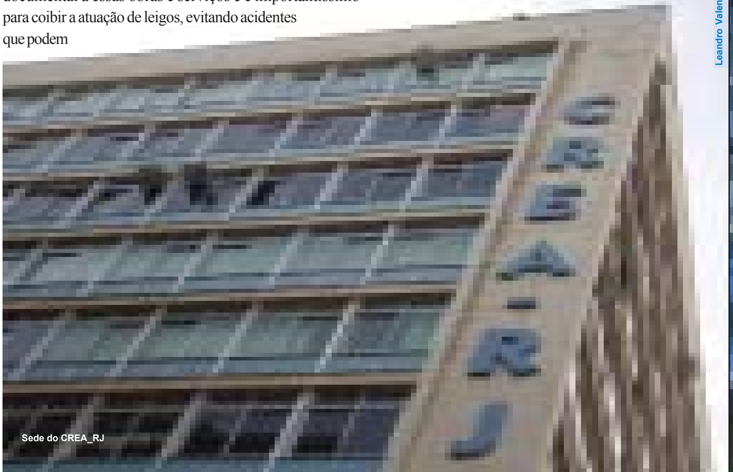
Sede do CREA_RJ